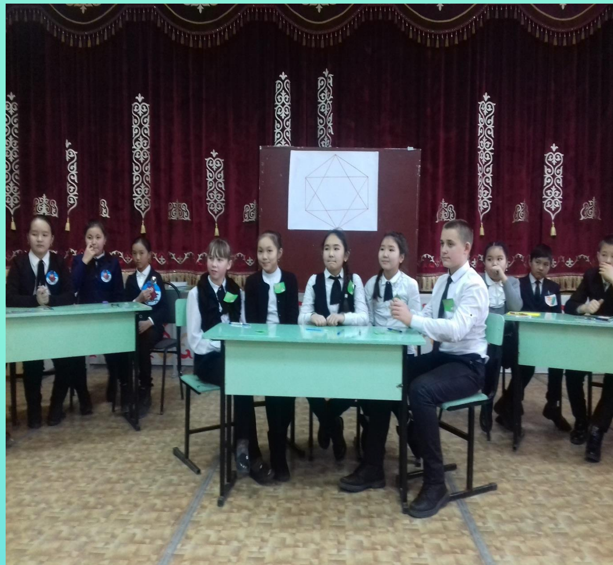
Турнир по математике 5 классов