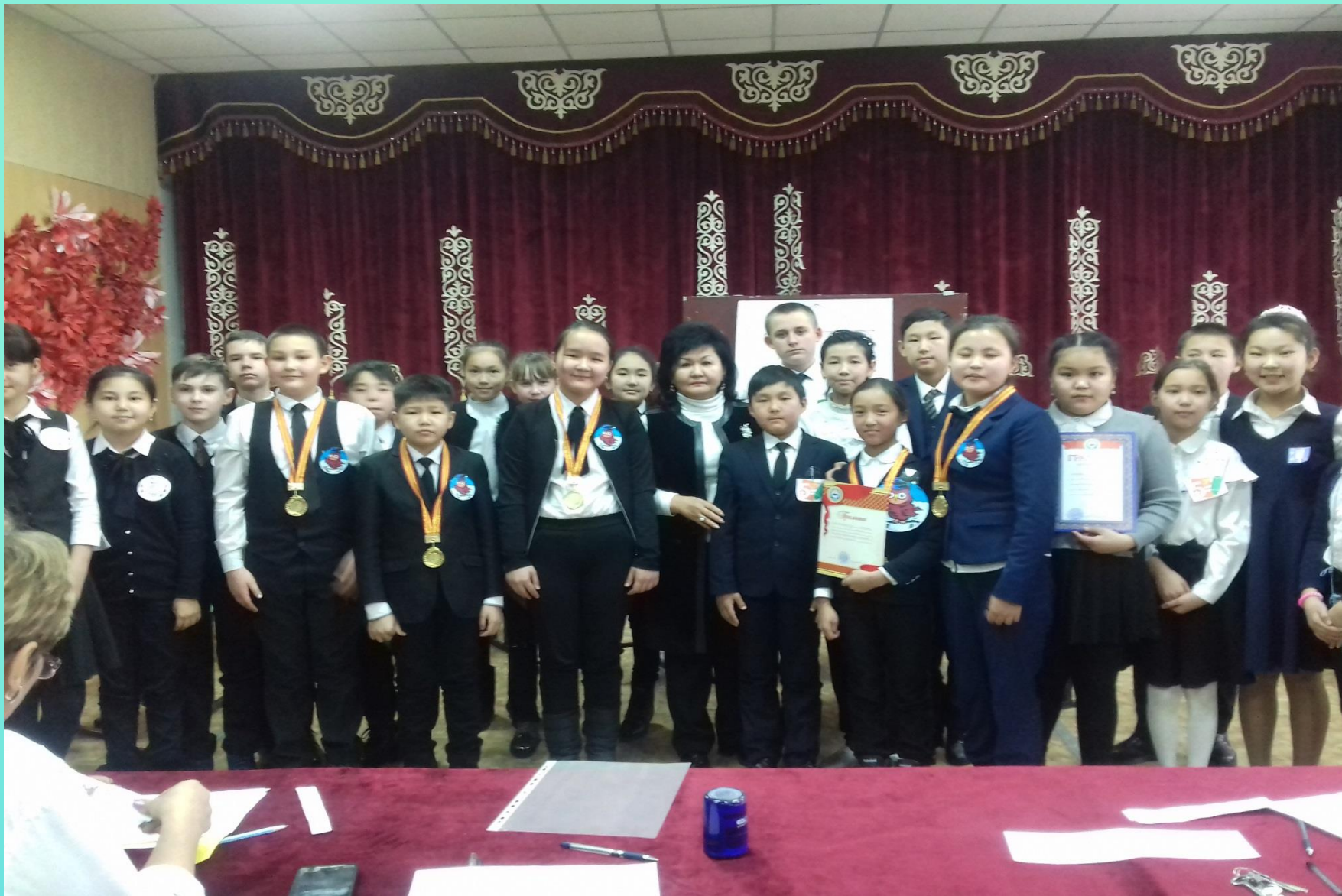
Награждение победителей турнира