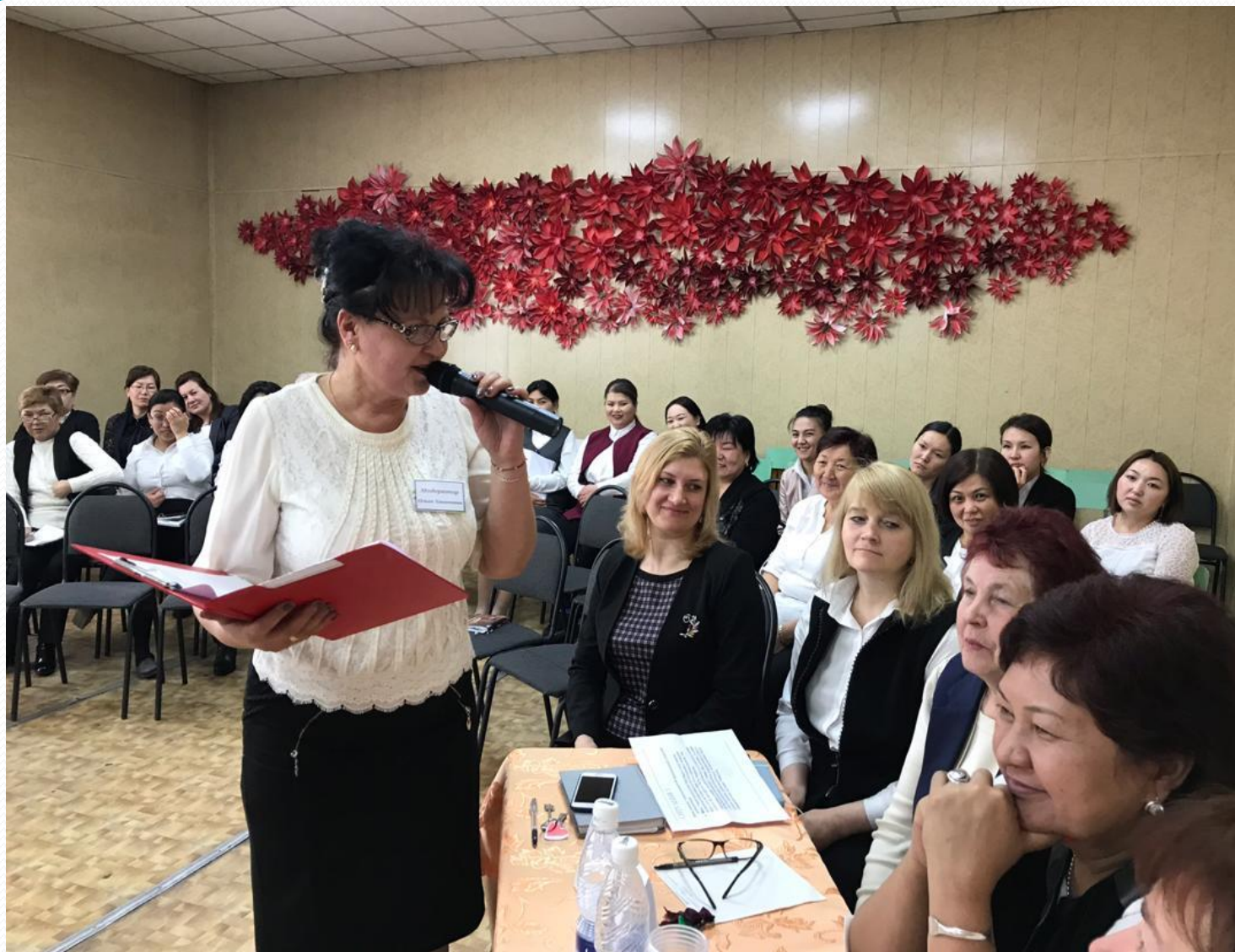
Интервью с классными руководителями