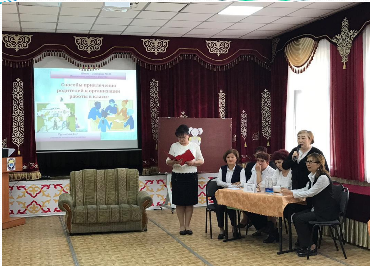
«Способы привлечения родителей к организации работы в классе»