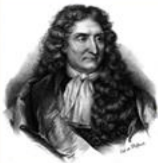
Жан де Лафонтен