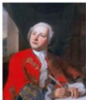
Михаил Васильевич Ломоносов