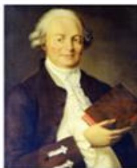
Василий Кириллович Тредиаковский