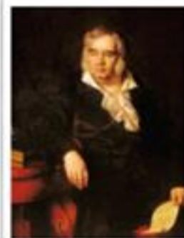
Иван Андреевич Крылов