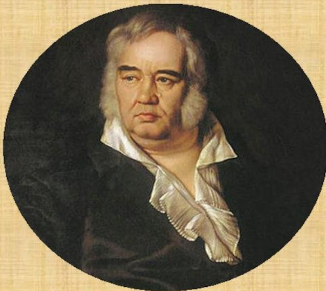
Иван Андреевич Крылов (1769-1844)