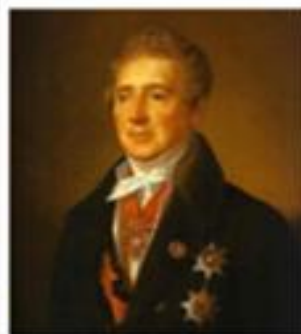
Иван Иванович Дмитриев